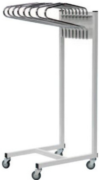
SPI-8219 SPI-8151 SPI-8153

- Lente Plomado : lente estándar con protección de 0.5 mm PB. Incluye estuche para protección.