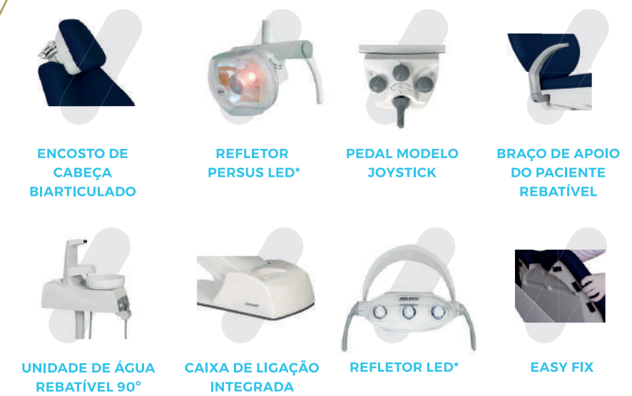
ENCOSTO DE CABEÇA BIARTICULADO