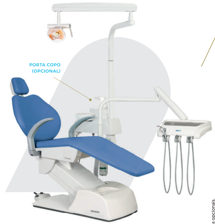
PORTA COPO (OPCIONAL)