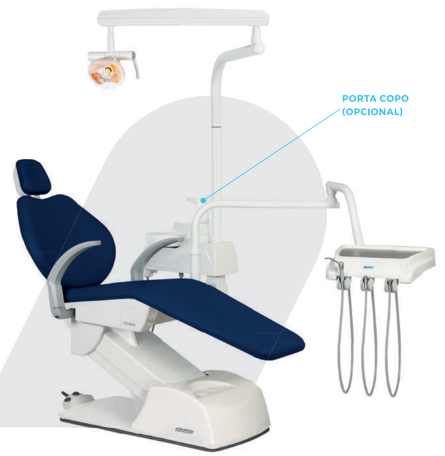
PORTA COPO (OPCIONAL)

N: não se aplica | O: opcional | S: série